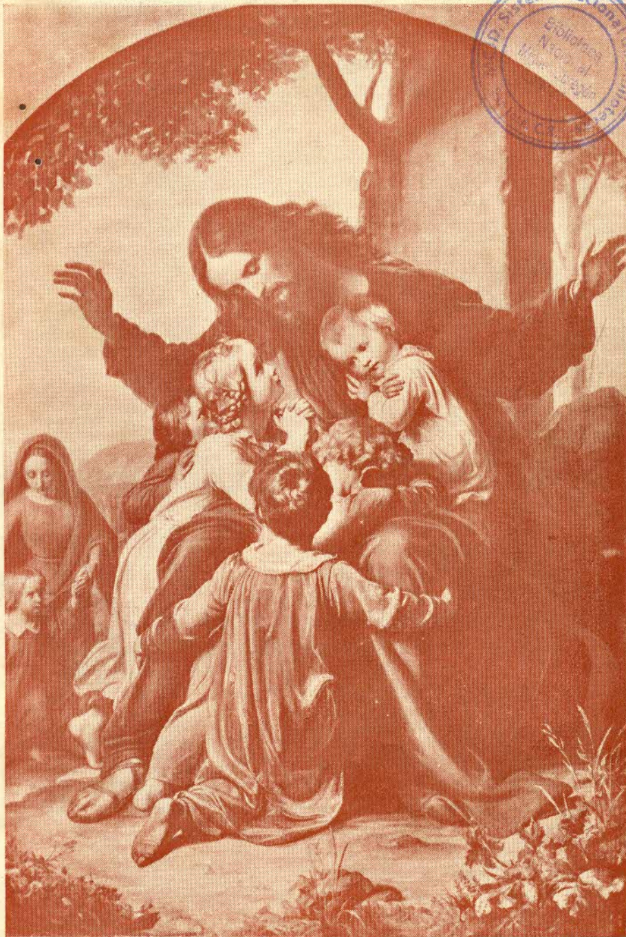
CUADRO DE VOGEL